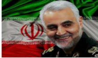
حاج قاسم سلیمانی سردار سلحشور سیاه و قهرمان انقلاب...